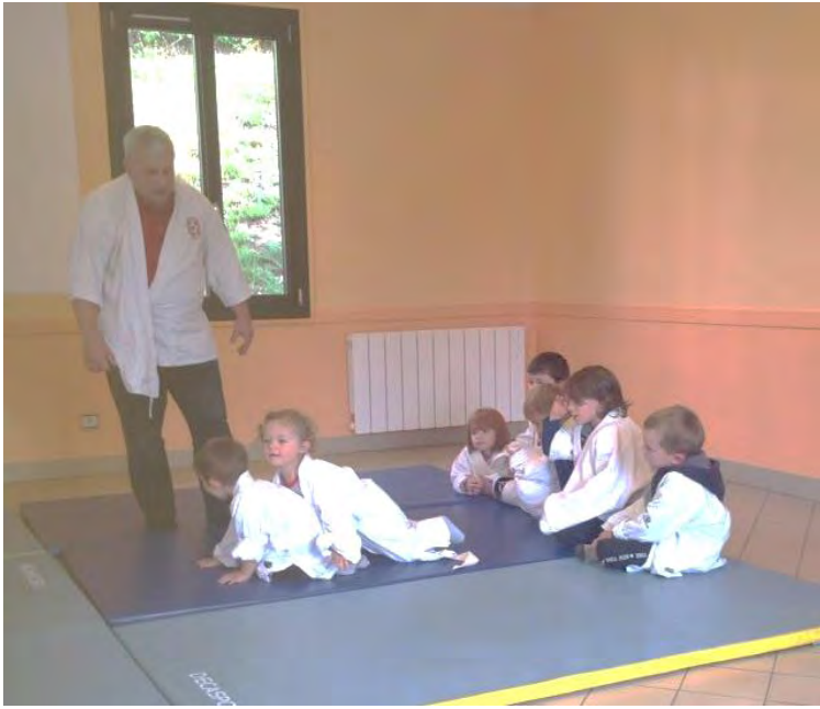
Initiation au judo à la salle des fêtes