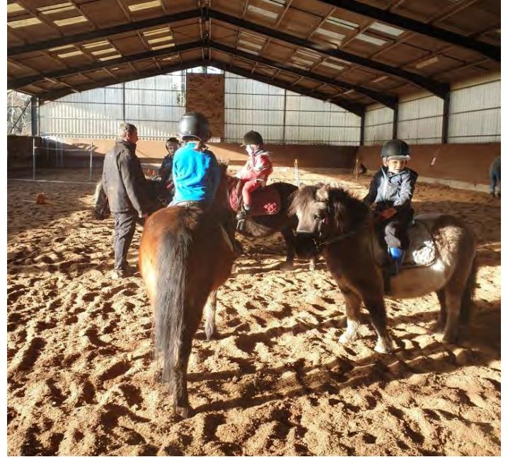
Le stage poney a débuté le 10 décembre