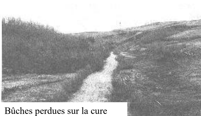
Bûches perdues sur la cure