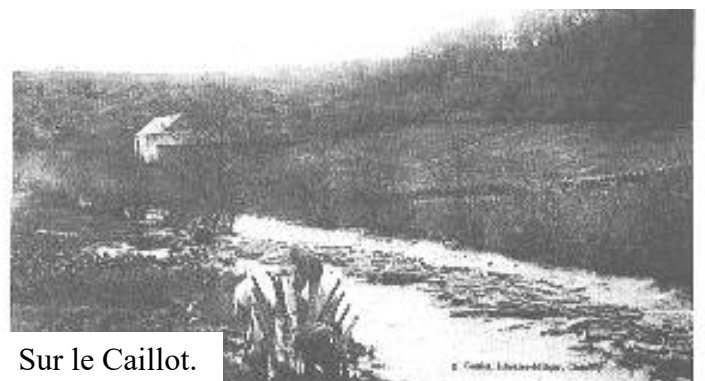
Sur le Caillot.