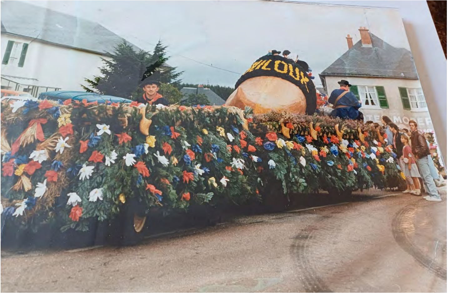
Char de Gouloux années 80