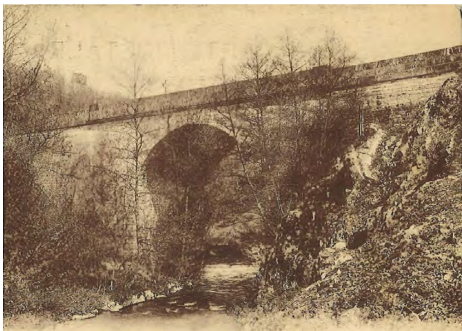
Pont Dupin en 1930.